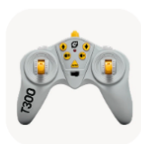
Игрушки на управлении