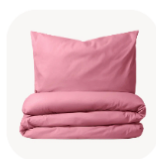
Товары для дома

Подразделы - это изображение с текстом, позволяющее разделить ассортимент на категории. Маленьких подразделов может быть от 4 до 28, они отображаются в выбранном продавцом порядке. Ссылка ведет на соответствующий изображению и подписи раздел.